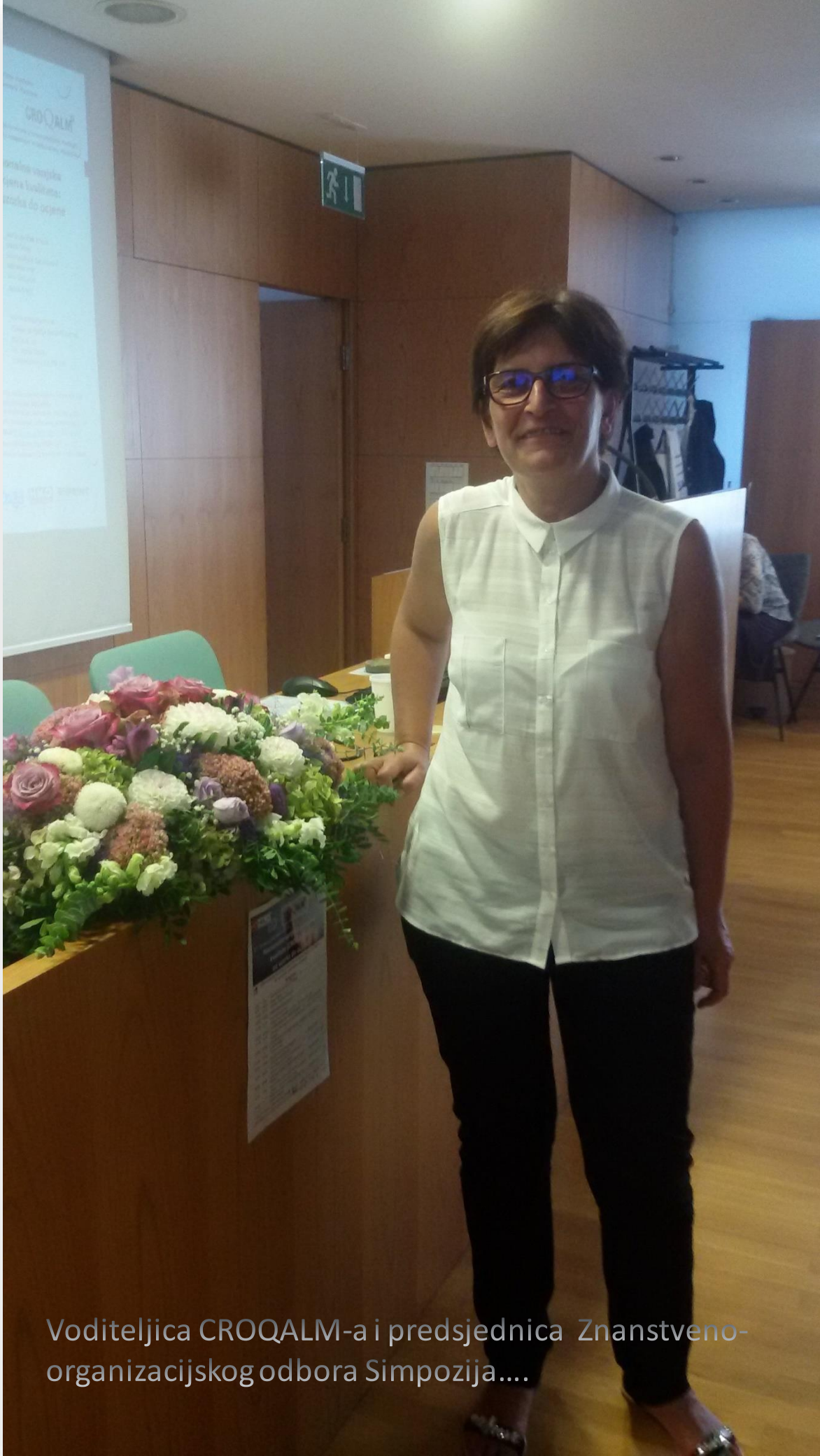
Voditeljica CROQALM-a i predsjednica Znanstveno- organizacijskog odbora Simpozija....