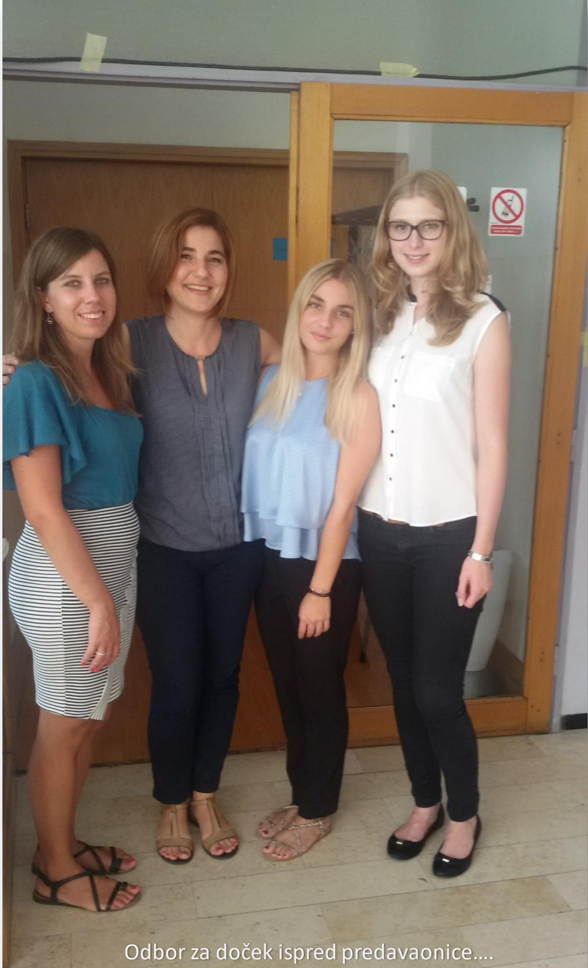
Odbor za doček ispred predavaonice....