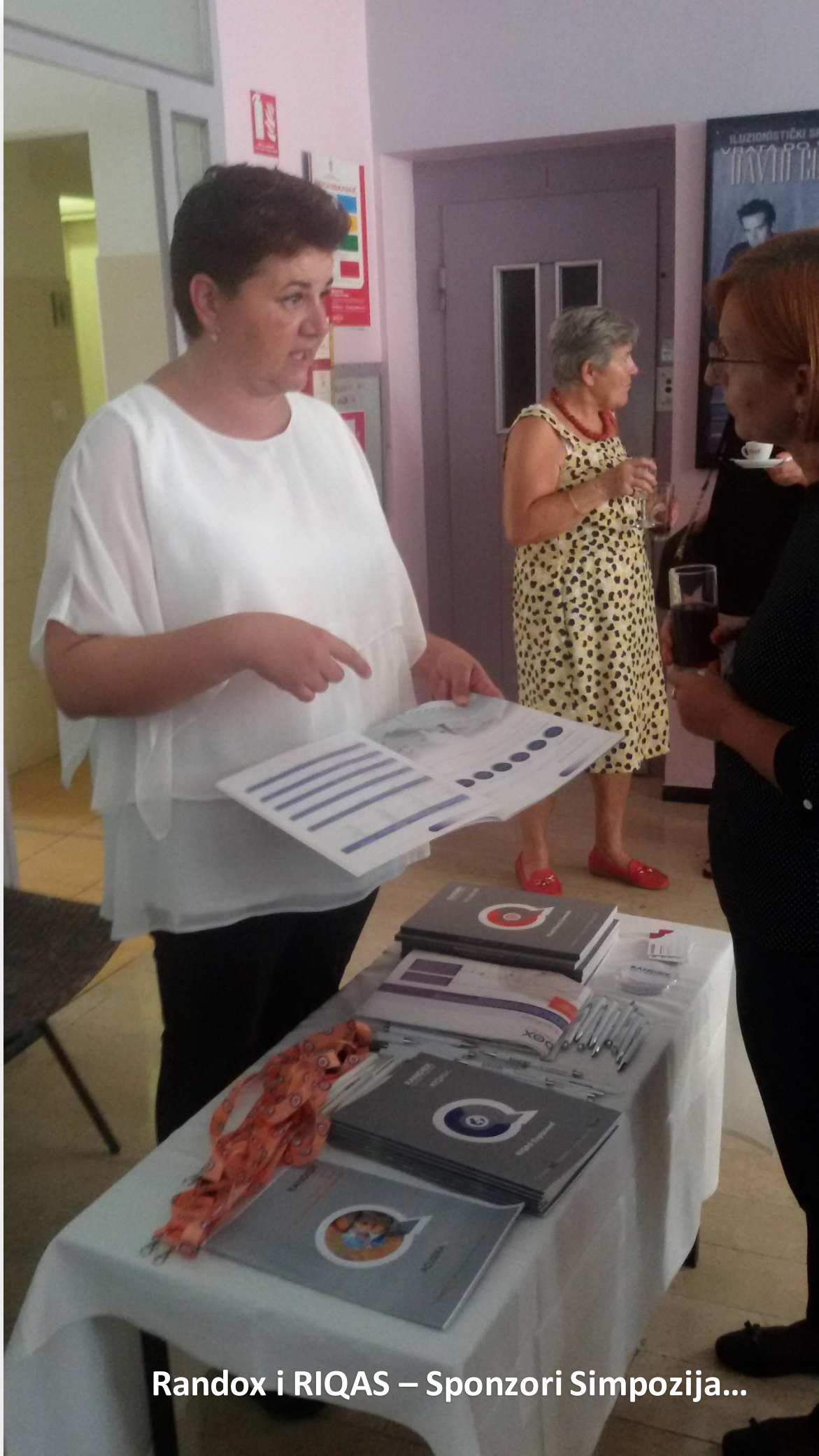
Radox i RIQAS – Sponzori Simpozija...